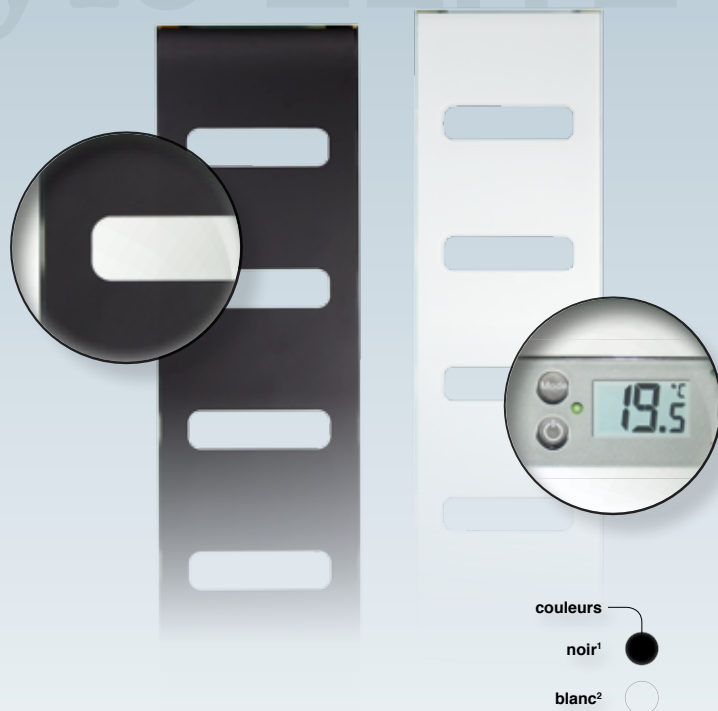
Carrosserie arrière : noire = 1 - blanche = 2

Pour optimiser les économies d'énergie, Campastyle GLACE peut faire l'objet d'une programmation centralisée par fil pilote et radiofréquence ou par cassette individuelle fil pilote ou courant porteur.